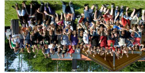
Jugendfreizeitleiter beim KJW

Ihr habt Spaß daran zusammen ein Event zu konzipieren und Teile des Veranstaltungsmanagements und der Veranstaltungstechnik kennen zu lernen? Dann seid ihr im Streetteam der Luise richtig! Meldet euch bei uns! Zudem wird das Streetteam als Talentscout, in der Öffentlichkeitsarbeit und im Radioprojekt Aufgaben übernehmen.